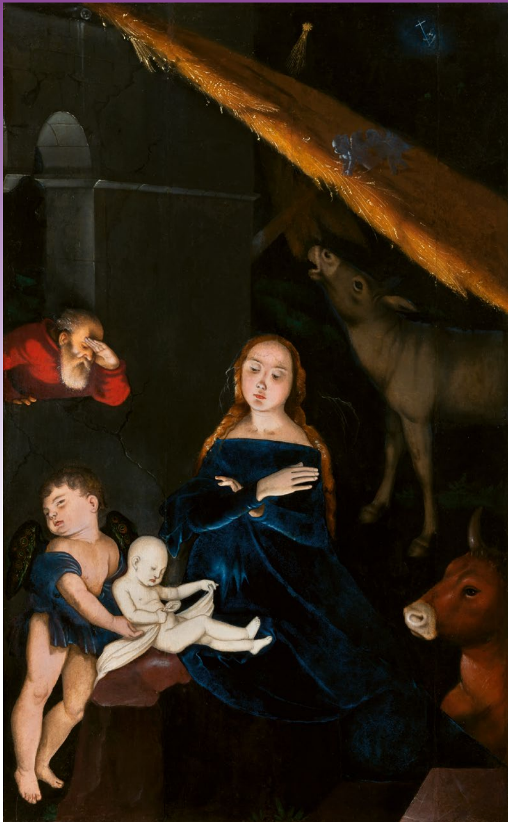
Hans Baldung (Grien) - Geburt Christi - Städel Museum, Frankfurt am Main